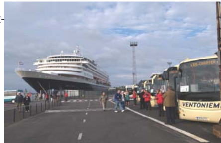
Risteilyvieraita odotetaan Helsingin satamassa

Jos tarvitset luotettavaa tilausbussikuljetusta soitto meili meille ja homma hoituu ammattitaidolla!