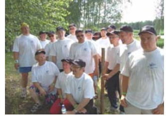
Soutujoukkue urakan jälkeen

Mommilanjärven soutelutapahtuma on muodostunut perinteiseksi kesätapahtumaksi myös Ventoniemellä. Tänä vuonna Ventoniemen henkilökunnan 15 henkinen joukkue osallistui souteluun 6 kerran. Joukkue souti yhdentoista kilometrin matkan reilusti alle tunnin ajassa 51.14.